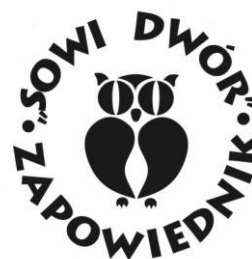
Centrum Leczenia Uzależnień „Zapowiednik”